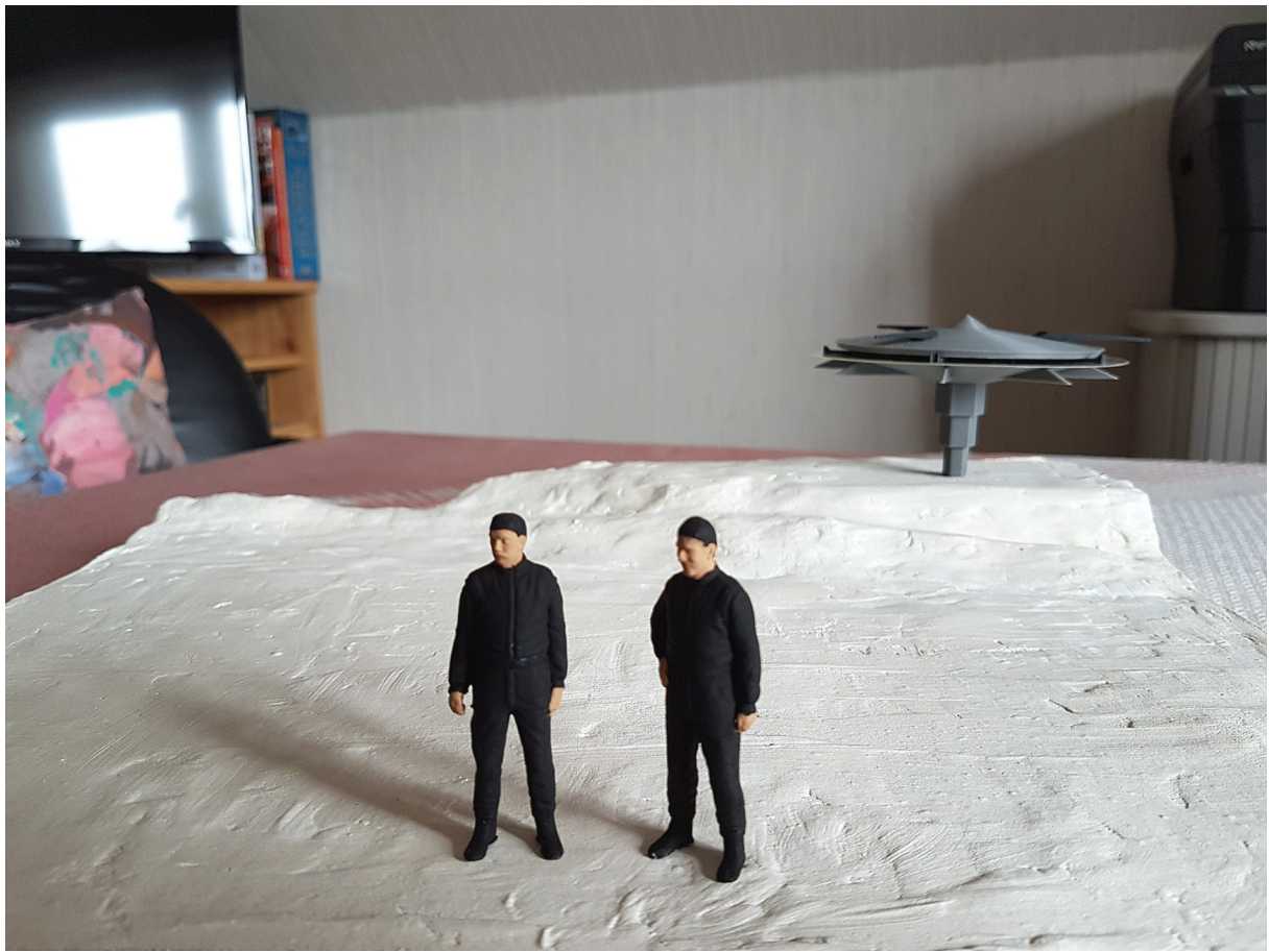
Erste Stellprobe. Die Figuren sind aber deutlich zu groß.