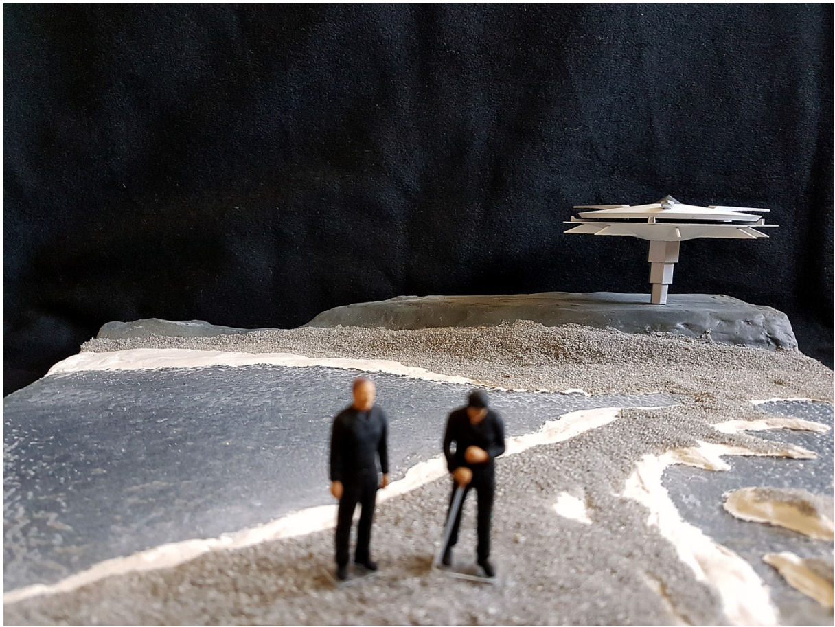
Fertiges Diorama aus verschiedenen Perspektiven