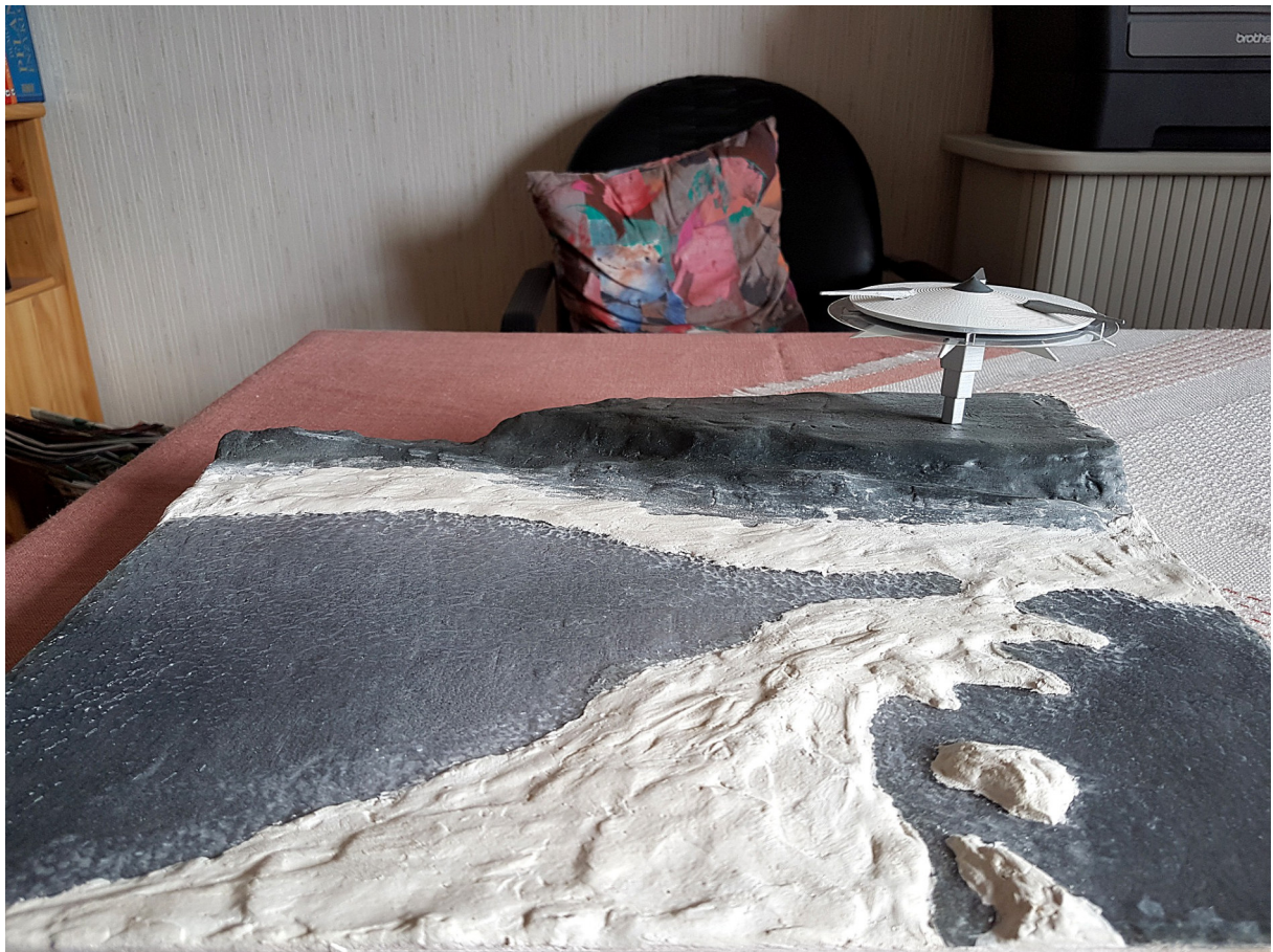
Gelände fertig modelliert, Seen eingefügt und erste Farbgebung.